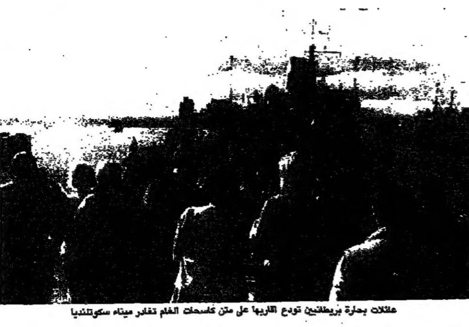
مجلات بحرية بريطانية تودع القربى على متن كاسحات الغم تقامر ميناء سكيكندرية.